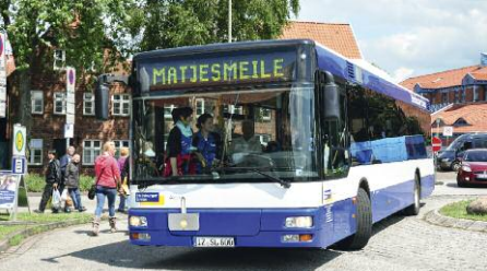
Glückstädter Matjes - immer eine Reise wert

Mit dem Auto - Anfahrt über die A23 aus Richtung Hamburg oder Heide/Husum.