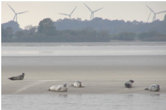
Seehunde auf der Brammer Bank.

Zum dritten Mal wird die Glückstadt Destination Management GmbH 2012 Naturerlebnisfahrten mit dem Tidenkieker von Glückstadt aus anbieten. An fünf Terminen startet das Flachbodenschiff vom Glückstädter Außenhafen aus zu den etwa dreistündigen Rundfahrten auf der Elbe. Erste Gelegenheit, mit dabei zu sein, ist am Sonntag, 20. Mai.