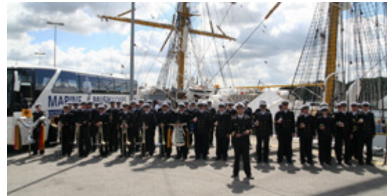
Die Konzerte des Marinemusikkorps erfreuen sich jedes Jahr großer Beliebtheit. Ein Muss für Musikfreunde!

hat weit mehr zu bieten als nur Militärmusik und Märsche. Von klassischer Musik über Blasmusik bis hin zu Musical und Big Band deckt das Musikkorps einen Großteil