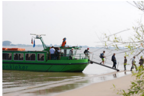
Landgang auf Schwarztonnensand.

Betrieben wird das Schiff vom Verein zur Förderung von Naturerlebnissen mit Sitz in Stade. Seit der Fertigstellung im Jahr 2005 ist der Tidenkieker auf der gesamten Unterelbe unterwegs.