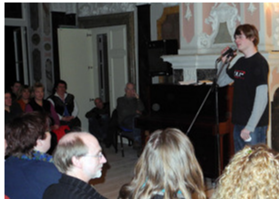
Der 1. Glückstädter Poetry Slam sorgte 2011 für einen ausverkauften Stucksaal im Wasmer-Palais.

Nach einem Jahr Pause ist der Poetry Slam pünktlich zum KulturMärz zurück in Glückstadt. Am Freitag, 16. März, um 19.30 Uhr laden die Kieler Kulturagentur assemble Art und die Glückstadt Destination Management GmbH in die Aula des Detlefsengymnasiums, Dänenkamp 5, ein.