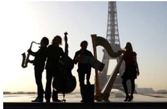
Quadro Nuevo ist mit dem aktuellen Programm „End of the Rainbow“ zu Gast.