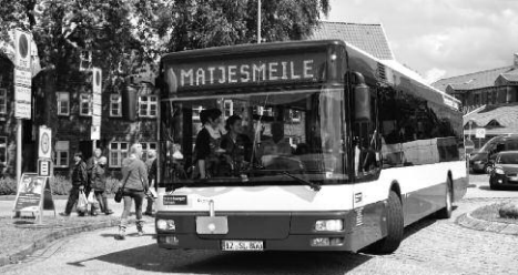
Glückstädter Matjes - immer eine Reise wert

Mit dem Auto - Anfahrt über die A23 aus Richtung Hamburg oder Heide/Husum.