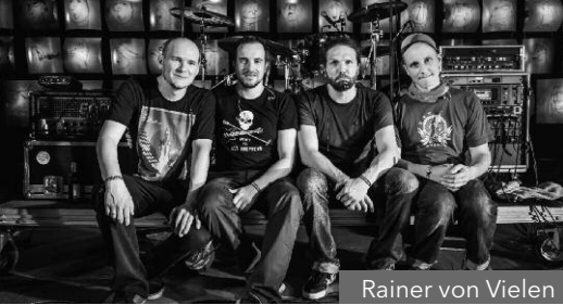
Rainer von Vielen