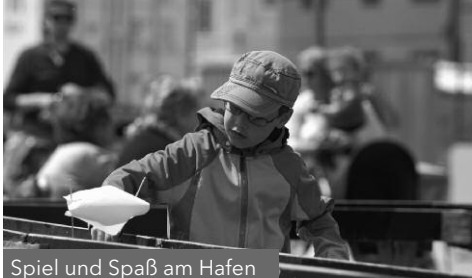
Spiel und Spaß am Hafen

Samstag und Sonntag 10.00 - 18.00 Uhr Binnenhafen