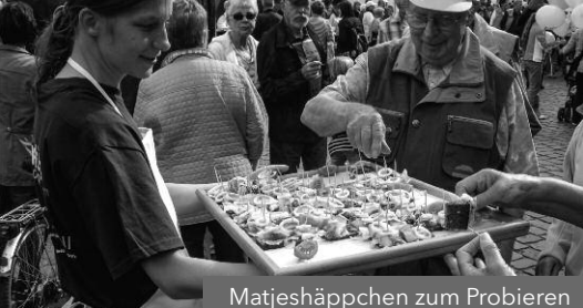
Matjeshäppchen zum Probieren