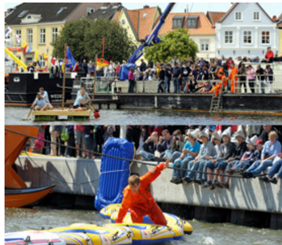
Sportlich wird es ebenfalls wieder bei der Hafenerquerung und bei der Plattschaukelregatta. Jeder kann mitmachen! Anmeldungen nimmt die Tourist-Information entgegen.

Für Action auf dem Wasser sorgen die Glückstädter Hafenerquerung am Samstag um 15 Uhr sowie die Plattschaukelregatta-Weltmeisterschaft am Sonntag ab 13 Uhr. Präsentiert von der Volksbank Elmshorn, Filiale Glückstadt, erwartet die Teilnehmer der Hafenerquerung eine äußerst wackelige Angelegenheit und sportliche Herausforderung. Trockenen Fußes müssen aneinander gereihte Schlauchboote überquert werden. Wer dies am schnellsten schafft, gewinnt. Für die Plattschaukelregatta ist Teamgeist gefragt. Zu viert geht es darum, mit auf Fässern geschraubten Flößen und handelsüblichen Schaufeln schnellstmöglich die Strecke zu paddeln.