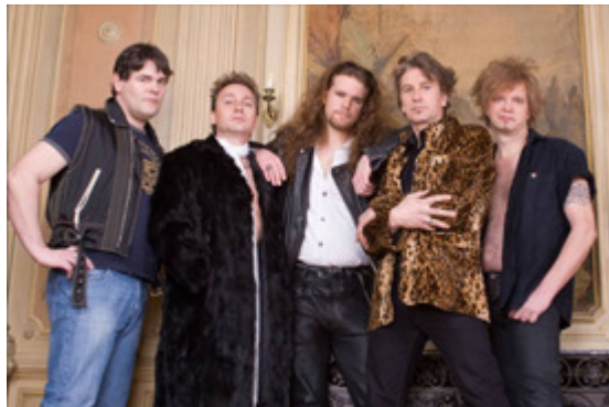
The Rockalots aus Bremen.

Ihre Vision ist nicht mehr und nicht weniger als die Bühnenreanimation der glorreichsten Momente unsterblicher Helden wie AC/DC, Led Zeppelin, Deep Purple, The Who und vielen anderen. „The Rockalots“ spielen nicht nur Rock, sie zelebrieren ihn – und dies mit einer Ehrlichkeit und Leidenschaft, die ihresgleichen sucht. Let's „Rock and Roll all Nite“!