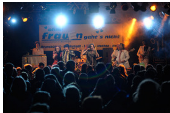
Los geht's... Jetzt darf gefeiert werden!

Ein Fest für alle Sinne, das sind die Glückstädter Matjeswochen. Sehen, Hören, Riechen und Schmecken. Dabei stehen Letztere verständlicherweise im Mittelpunkt. Ob als Matjeshäppchen oder Fischbrötchen, klassisch mit Bratkartoffeln oder nach Hausfrauenart oder zum Mitnehmen für Zuhause gibt es den Original Glückstädter Matjes in vielfältigsten, leckeren Variationen. Auch Nicht-Fischesser kommen auf ihre Kosten und finden zahlreiche Angebote von deftig bis süß.