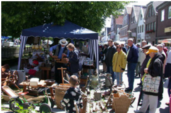
Stöbern, kaufen und verkaufen auf der großen Flohmarkt-Meile am Samstag und Sonntag.

Am Wochenende erwartet die Glückstädter Matjesmeile die Besucher. Die Glückstädter Innenstadt verwandelt sich in einen riesigen Flohmarkt und lädt zum Stöbern, Handeln und Klönen ein. Ob alt oder neu, nützlich oder skurril, Rarität oder Schnäppchen – es gibt in jedem Fall viel zu entdecken. Dazu bieten zahlreiche gewerbliche Stände alles, was das Herz begehrt: Schmuck, Kunsthandwerk, schöne Pflanzen oder Dekoideen.