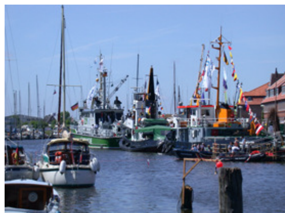
Der Hafen wird am Samstag und Sonntag wieder einer der Hauptanziehungspunkte der Glückstädter Matjeswochen sein.

Der Binnenhafen mit der historischen Häuserzeile, den Hafentreppen und der Hafensperrmauer ist mit seinem maritimen Flair eine der Hauptsehenswürdigkeiten der Stadt. Dank der Organisation der Inte-