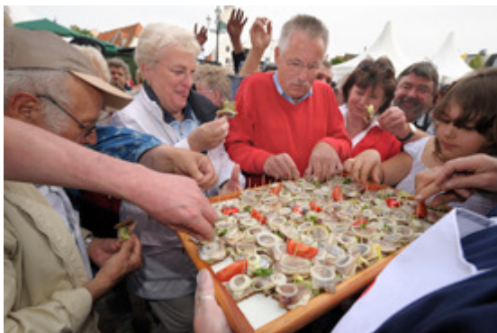
Um ihn dreht sich alles - Original Glückstädter Matjes.