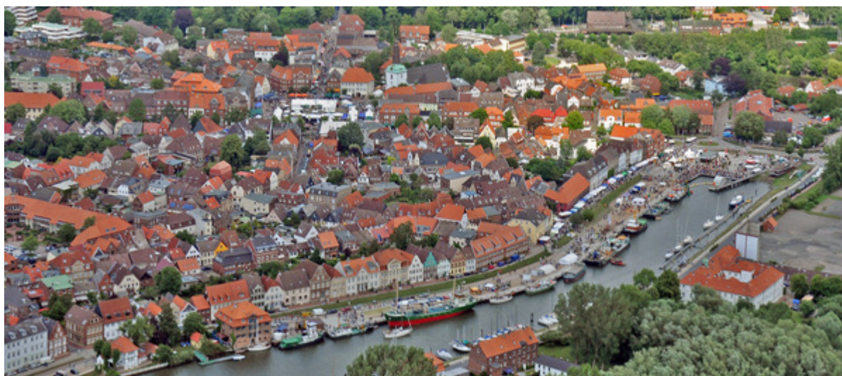
Die Glückstädter Matjeswochen von oben. Auch in diesem Jahr ist wieder Gelegenheit mit den Hubschraubern der Firma Koopmann Helicopter zu einem Rundflug zu starten.