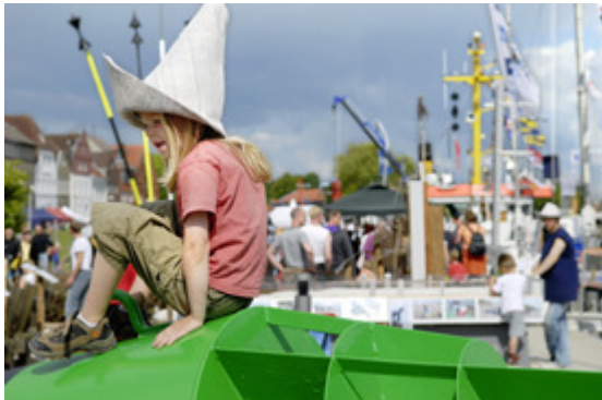
Kinder können sich auf zahlreiche Spiel- und Spaßaktionen freuen, am Samstag auf der Kindermeile rund um die Stadtkirche und an beiden Tagen entlang der Hafenpromenade.

fläche gibt es leckeren Kaffee und Kuchen vom Kindergarten Borsfleth. Glücksrad und Erbsenhaumaschine sind in diesem Jahr auch wieder vertreten. Und es geht tierisch zu. Die Hundeschule Sweety Dogs präsentiert ihre Vierbeiner beim Agility in Aktion. Am Nachmittag lädt der Hof Franzensburg zum Ponyreiten ein. Davon träumen nicht nur kleine Mädchen.