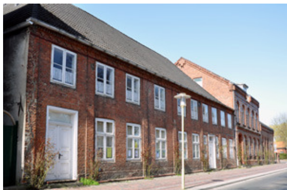
Die Druckerei J.J. Augustin am Fleth 36-37.

Das Stadtdenkmal Glückstadt blickt auf eine fast vierhundertjährige Geschichte zurück. Der dänische König Christian IV. gründete die Stadt an der Elbe 1617 als Konkurrenz zu Hamburg und ließ sie nach dem Vorbild einer italienischen Renaissancestadt anlegen. Davon zeugt der spinnennetzartige Grundriss bis heute. Der historische Stadtrundgang folgt diesem Grundriss und führt zu den wichtigsten, erhaltenen Denkmälern der Stadt. Auch die Stadtkirche, das älteste Gebäude Glückstadts, wird besichtigt. Beginn ist um 15 Uhr am Marktplatz. Die besondere Architektur, Gestaltung und Geschichte der Stadtkirche sind zudem Inhalt einer gesonderten Führung, die um 14.30 Uhr beginnt.