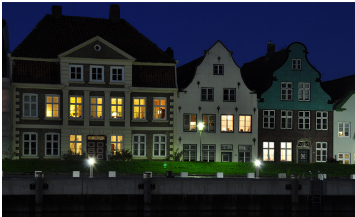
Abendstimmung am Glückstädter Binnenhafen. Am 12. September lädt die Kulturnacht zu einer abendlichen Entdeckungstour durch die Glückstädter Kulturlandschaft ein.