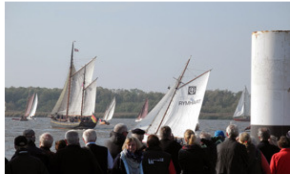
Beeindruckende Bilder vor der Glückstädter Mole, wenn rund 40 Gaffelsegler auf der Elbe Segel setzen.

Immer am ersten Oktoberwochenende findet in Glückstadt die Gaffelwettfahrt „Rund um die Rhinplate“ statt. Die Regatta gibt es seit Jahrzehnten. Sie ist die älteste Wettfahrt für Traditionssegler in Deutschland.