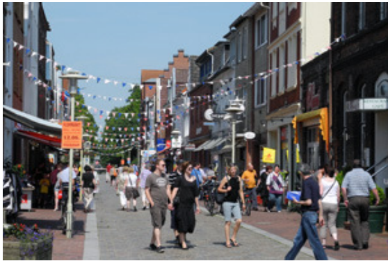
Einkaufsbummel in der Innenstadt.

„Glückstadt für Familien“, heißt es zum verkaufsoffenen Sonntag am Sonntag, 6. September. Von 13 bis 17 Uhr öffnen die Geschäfte der Innenstadt und laden zum gemütlichen Einkaufsbummel ein. Rundherum gibt es für Kinder, Familien und alle anderen viel zu entdecken.