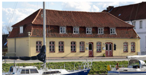
Auch das Brückenhaus am Rethövel kann zum Tag des offenen Denkmals besichtigt werden.

Ein weiteres historisches Kleinod ist das Brückenhaus, Am Rethövel. In diesem Frühjahr wurde das Haus komplett im Sinne des Denkmalschutzes saniert und als kleines Hotel neu eröffnet. Für Interessierte bietet Familie Diedrichsen Führungen durch das Gebäude an.