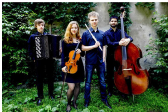
Ethnogarden spielt traditionelle Lieder und eigenen Kompositionen. Letztere verbinden sie atmosphärisch mit dem Krakauer Stadtteil Kazimierz.